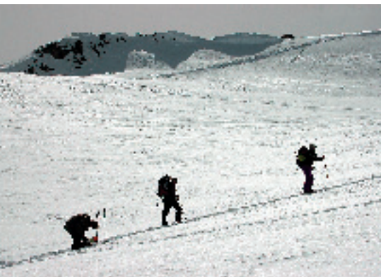
Andermatt - šlapání za prašanem

Území středního Švýcarska nabízí řadu zapomenutých ski resortů. Středisko Disentis slibuje celou škálu výstupů a freeridových terénů. Terén sjezdovek je členitý a nabízí jízdy v různých údolích. Naše skupina se soustředila na výstupy v oblasti, které dominuje hora Oberalpstock (3 327 m). Rozprostírá se zde jedno z dominantních freeridových údolí sjízdné při dostatku sněhu až téměř k prvním obydlím ve vesnici Sedrun. Z vrcholu hory Oberalpstock vede několik freeridových tras. Po dobu BC kempu si