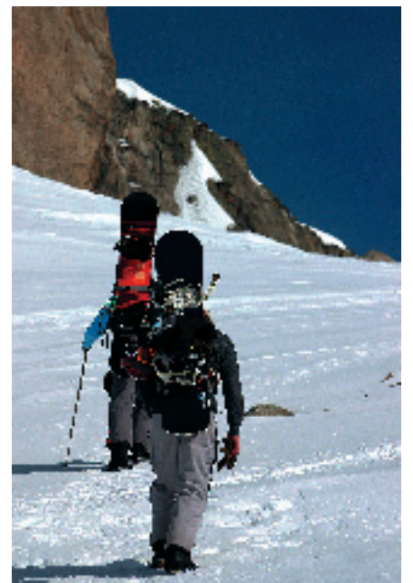
Disentis - nástup do backcountry